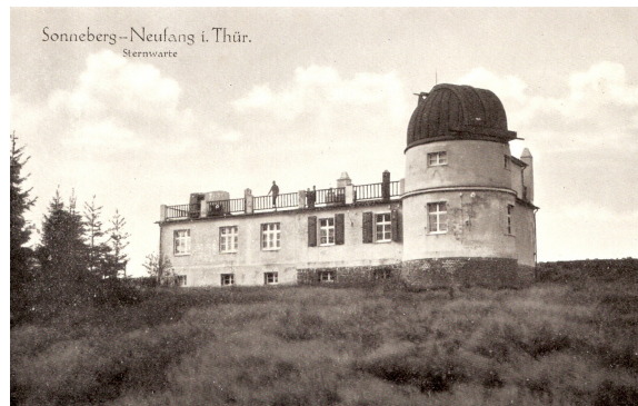
Die Sternwarten Bamberg and Sonneberg (1930)

Bamberg and Sonneberg – centers of study of variable stars, their relationship and cooperation